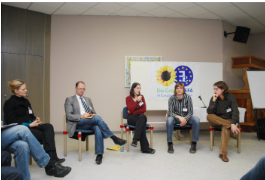
Auch die Studierenden bekamen ihre Redezeit in der Abschlussrunde.

Jede Menge Denkanstöße, vor allem zwei Seiten: Dass sich nach der Meinung der älteren Professoren nichts verändern soll, und die Seite der Studierenden, die sagen, dass sich sehr viel verändern soll. Also den Bachelor verändern, ihn studierbarer machen, mehr Freiräume schaffen für individuelle Entfaltung. Ich nehme auch die Erkenntnis mit, dass man unterschiedlich mit Naturwissenschaften und Geisteswissenschaften umgehen muss, und dass die FHs noch einmal andere Bedürfnisse haben. Auch, dass Demokratie viel stärker an die Hochschulen gebracht werden muss.